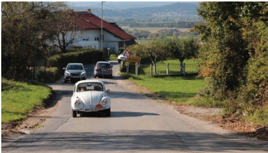
FOTOGRAFIJA: NADA IN JOŽEF POTRČ