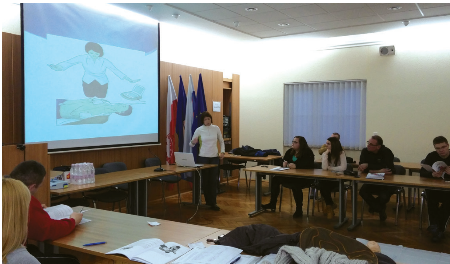
FOTOGRAFIJE: PGD RUŠE