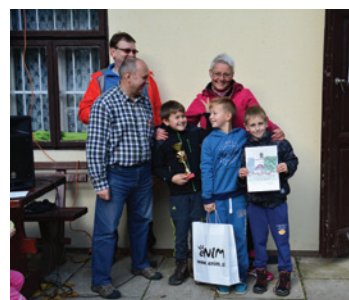
Mešančki - 1. mesto kategorija G (odprta).