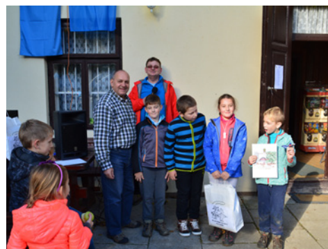
Bedanci - 1. mesto kategorija B.