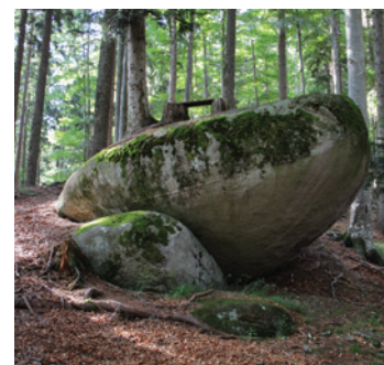
»Granitno jajce« v pragozdu Šumik.