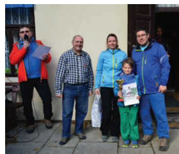
Kalimero - 1. mesto kategorija F.