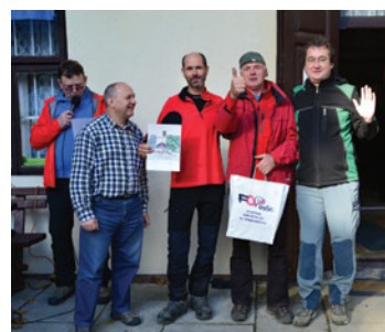
Joleji - 2. mesto kategorija C.

Iskrene čestitke vsem ekipam iz Planinskega društva Ruše za dosežena kar štiri 1. mesta, dve 2. mesti in po eno 3., 4. in 5. mesto. ■