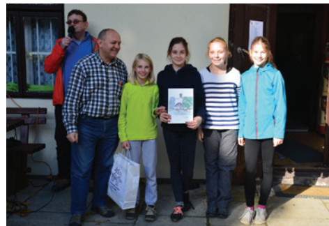
Pustolovci - 2. mesto kategorija B.