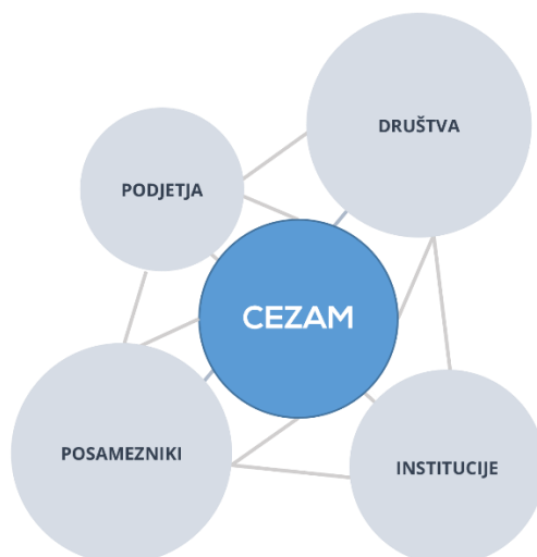
Skica 1: Vloga CEZAMa kot facilitatorja mreže deležnikov v okolju.

Namen vloge ter izhajajočih dejavnosti je v različne projekte vključevati čim več deležnikov iz lokalnega okolja in širše.